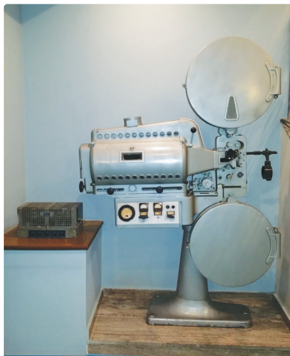
Η μηχανή Malinverno και ο ενισχυτής ήχου Magneti Marelli του θερινού ΣΙΝΕ ΠΑΝΤΕΛΗΣ