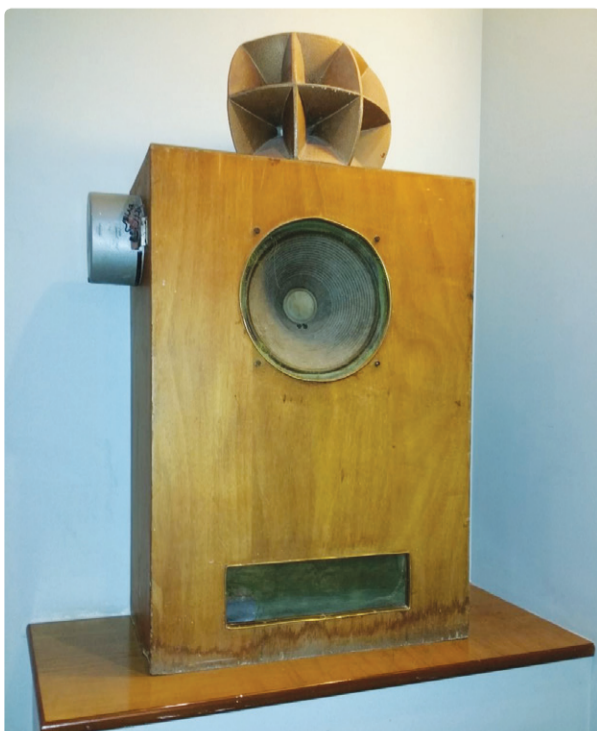
Το ξύλινο ηχείο θερινού κινηματογράφου, κατασκευής Μανόλη Λεμονάκη

ΑΡΙΣΤΕΡΑ: Διαφήμιση στην «Κρητική Επιθεώρηση» της έναρξης λειτουργίας του θερινού ΣΙΝΕ ΠΑΝΤΕΛΗΣ (15.07.1966)