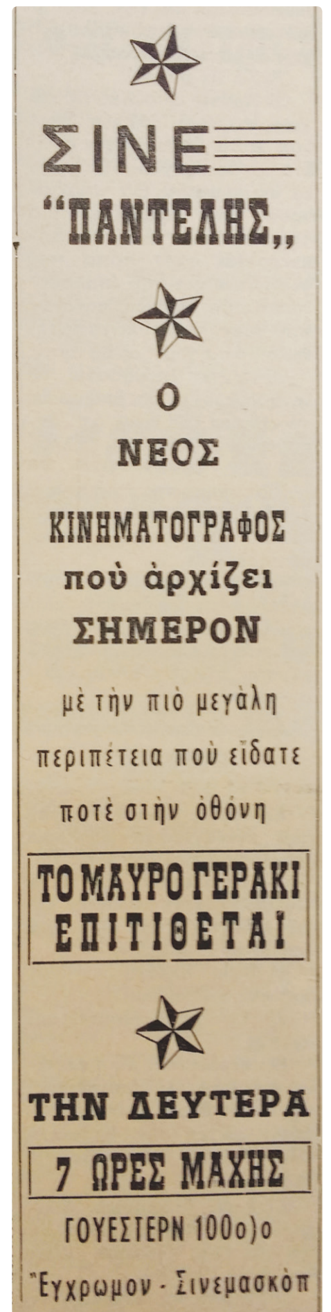
ΠΑΝΩ: Καταχώρηση της πρώτης ταινίας του θερινού «Ρεθηνιώτικα Νέα» 16.07.1966

Έντός της εβδομάδος Αρχίζει την λειτουργία του ο νέος θερινός Κινηματογράφος ΠΑΝΤΕΛΗΣ Είς την Συνοικίαν Καλλιθέα